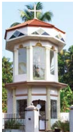
സെന്റ് ആന്റണീസ് കപ്പേള (തെക്കുഭാഗം)

ഇടവകയുടെ വടക്ക്-തെക്ക് അതിർത്തികളിൽ വി. യൗസേപ്പ് പിതാവിന്റെയും വി. അന്തോണീസിന്റെയും നാമത്തിൽ ഓരോ കപ്പേള സ്ഥിതിചെയ്യുന്നു. മാസത്തിൽ യഥാക്രമം ആദ്യ ചൊവ്വാഴ്ചയും ബുധനാഴ്ചയും പ്രസ്തുത കപ്പേളകളിൽ നൊവേന, ലദീഞ്ഞ് എന്നീ തിരുകർമ്മങ്ങൾ നടത്തപ്പെടുന്നു. ഈയിടെ നിർമ്മിച്ച