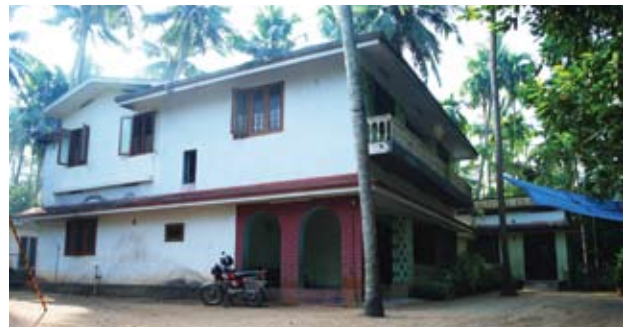
കാതറിൻ ലബോറെ കോൺവെന്റ്

ചാരിറ്റി എന്ന സന്യാസിനീസമൂഹത്തിന്റെ ഒരു ഭവനം സെന്റ് കാതറിൻ Laboure ഹൗസ് എന്ന പേരിൽ ഈ ഇടവകയിൽ സ്ഥാപിതമായത്. ക്രമേണ സെന്റ് കാതറിൻ ഇംഗ്ലീഷ് മീഡിയം സ്കൂളും ആരംഭിച്ചു. ഇടവകയിലെ വിവിധ മേഖലകളിൽ ബഹു. സിസ്റ്റേഴ്സ് വിശിഷ്ടസേവനം അനുഷ്ഠിച്ചുപോരുന്നു.