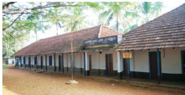
ഫാത്തിമമാതാ എൽ.പി. സ്കൂൾ