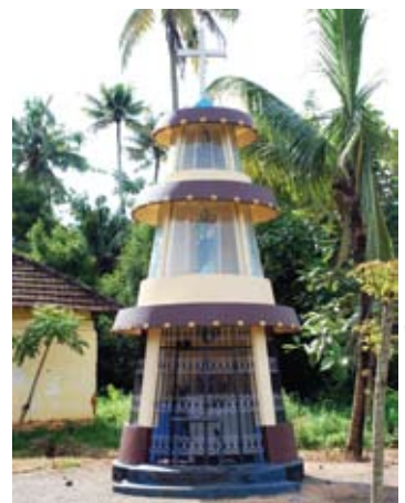
സെന്റ് ജോസഫ്സ് കപ്പേള (വടക്കുഭാഗം)