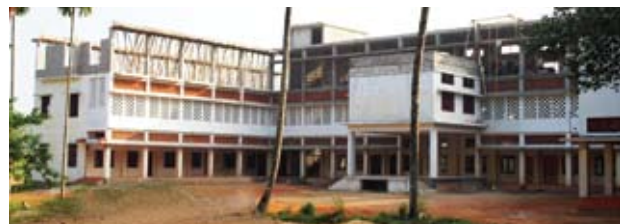
സെന്റ് കാതറിൻ ഇംഗ്ലീഷ് മീഡിയം സ്കൂൾ